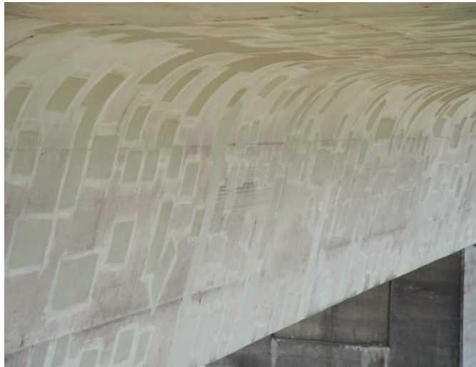
Bild 5 Brückenunterseite mit sanierten Korrosionsschäden.