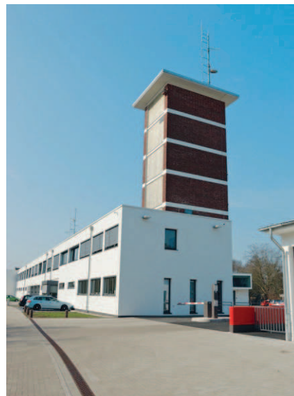
Bild 1 Einfahrt Feuerwache Hilden

Als Architekt war das Düsseldorfer Büro Buddenberg Architekten beauftragt. IDK Kleijohann GmbH & Co. KG Köln, Beratende Ingenieure für das Bauwesen, wurde mit den Leistungsphasen 1-6 HOAI – also von der Grundlagenermittlung bis zur Ausführungsplanung – in der Disziplin Tragwerksplanung beauftragt. Außerdem erarbeitete der Tragwerkspezialist als be-